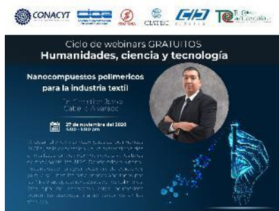
Regístrate en la siguiente liga: https://www.webinars.ciqa.mx

Durante los últimos años las actividades de difusión y divulgación de la ciencia y la tecnología han sido realizadas por el personal académico del CIQA, quienes han preparado actividades dirigidas tanto a niños como a jóvenes de las instituciones educativas de la región, las cuales han sido muy bien recibidas lo que motiva al personal a hacerlo cada vez mejor. La difusión que se ha dado a estas actividades ha permitido que cada año se aumente el número de actividades y asistentes, aumentando la interacción que se tiene con las instituciones de educación básica, media y superior del Estado, aunque se limitó un poco por la pandemia, se espera que se continúe con esta actividad que es muy importante para el CIQA.